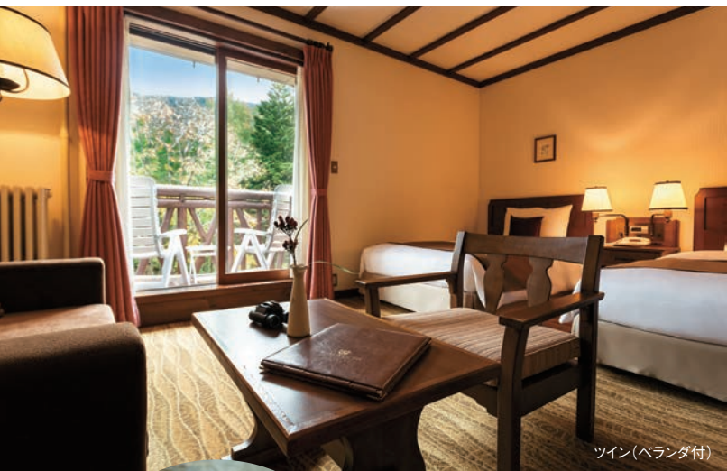
ツイン(ベランダ付)

大自然と共存する“サステナブル”なホテルであるために。 脱炭素(カーボンニュートラル)、脱プラスチック、そして地域との深い絆など SDGsに貢献するおもてなしをスタッフをご提案いたします。